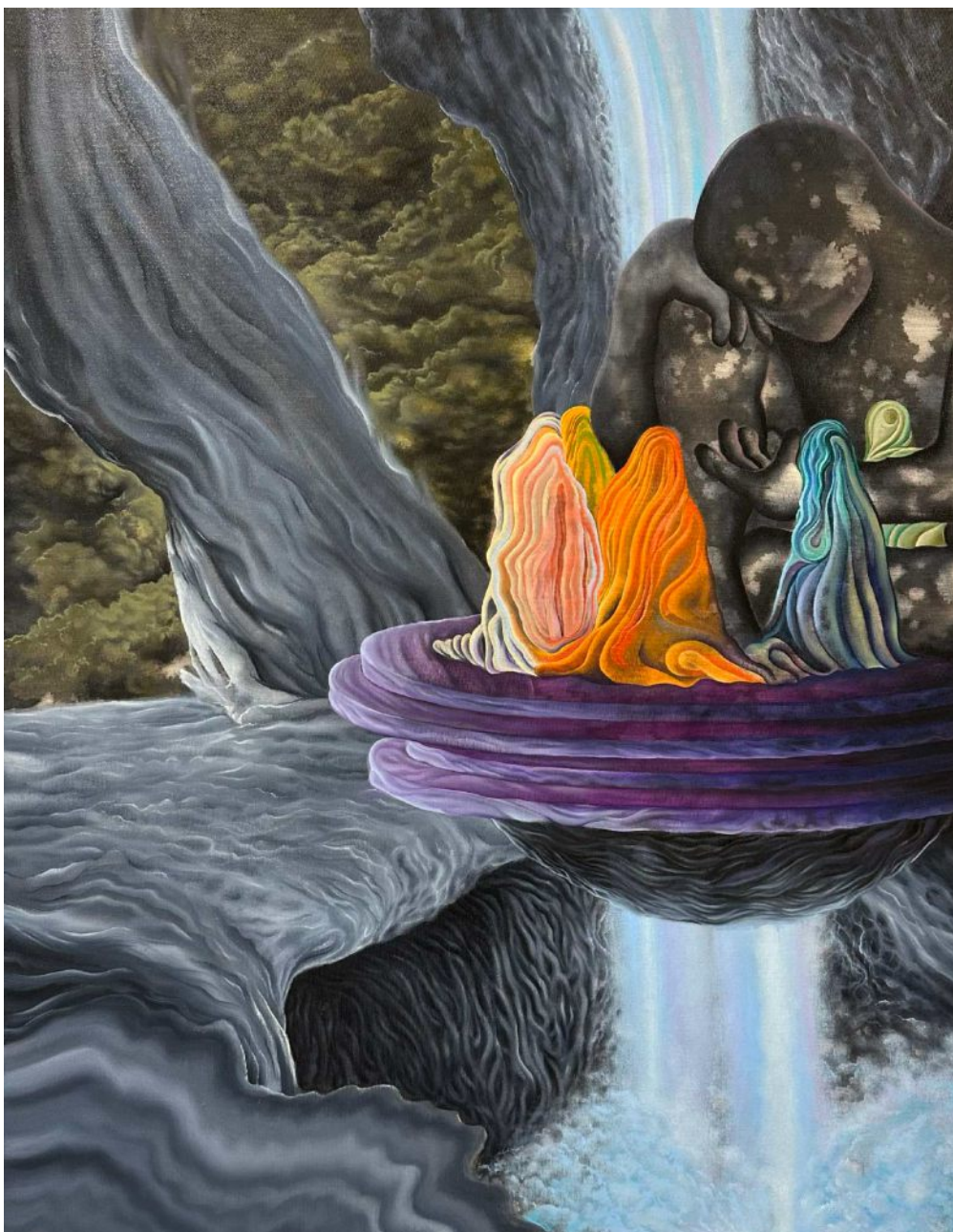
BS 5/ The Messenger olej na plátne, 90 x 70 cm, 2025