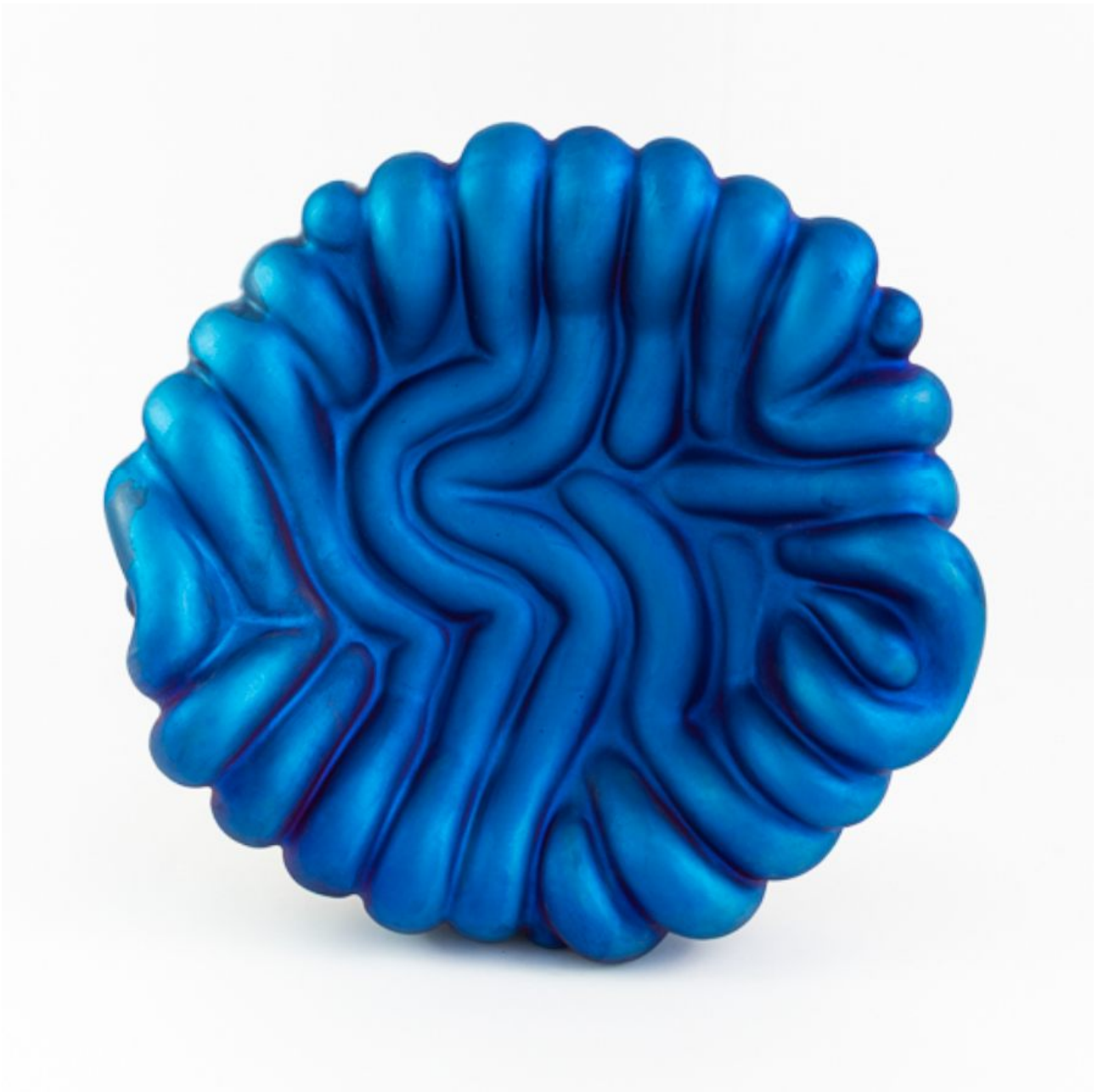
FETISHMOPRHY OBJECTS M 35 cm 1 ks french porcelain matt / titanium-plated blue