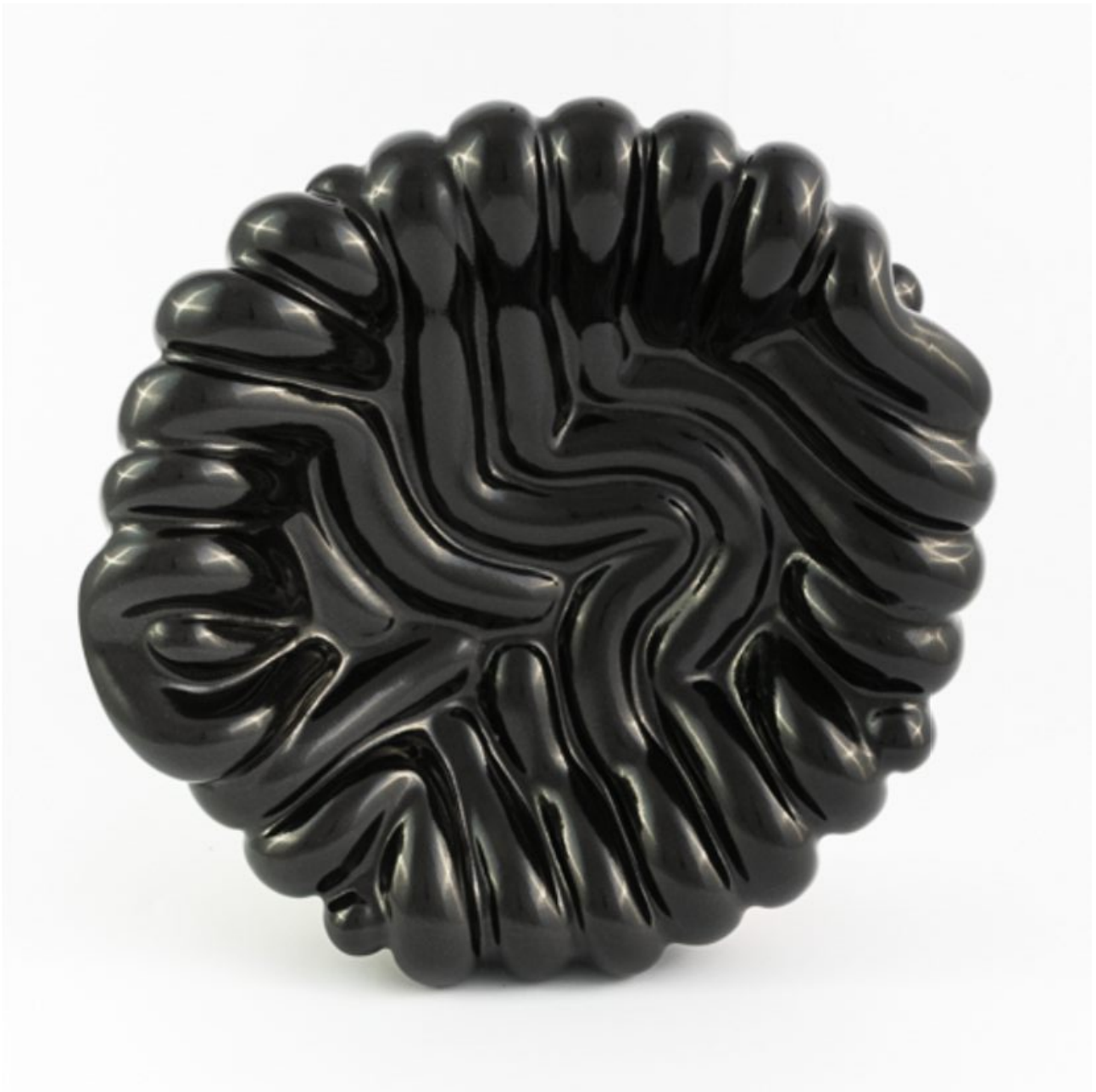
FETISHMOPRHY OBJECTS S 20 cm 1 ks french porcelain / black glaze