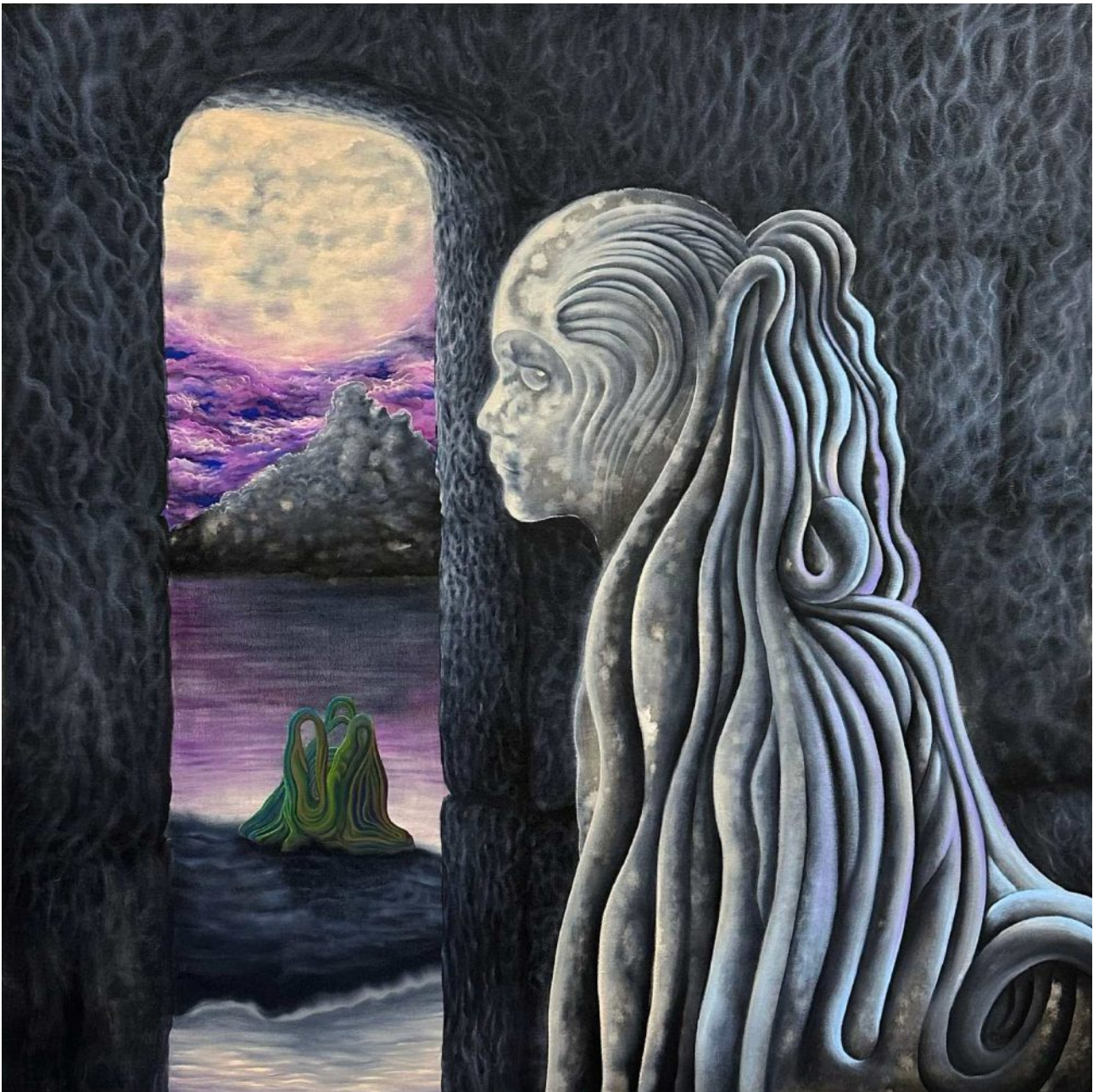
BS 3/ From the Window olej na plátne, 90 x 90 cm, 2025