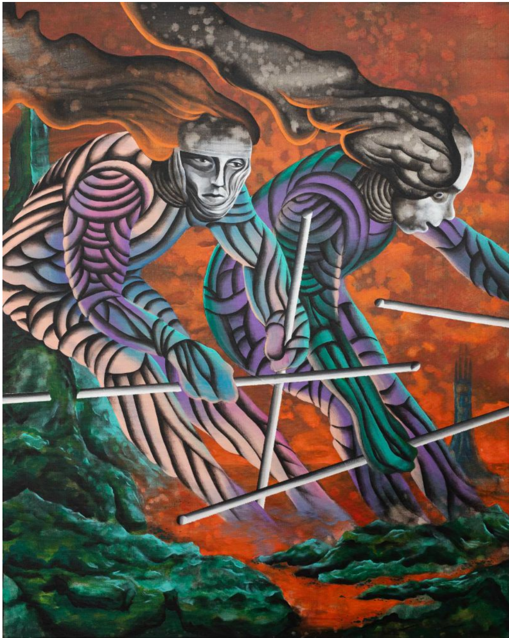
BS 13/ Futurism Now! #7 akryl na plátne, 100 x 80 cm, 2024