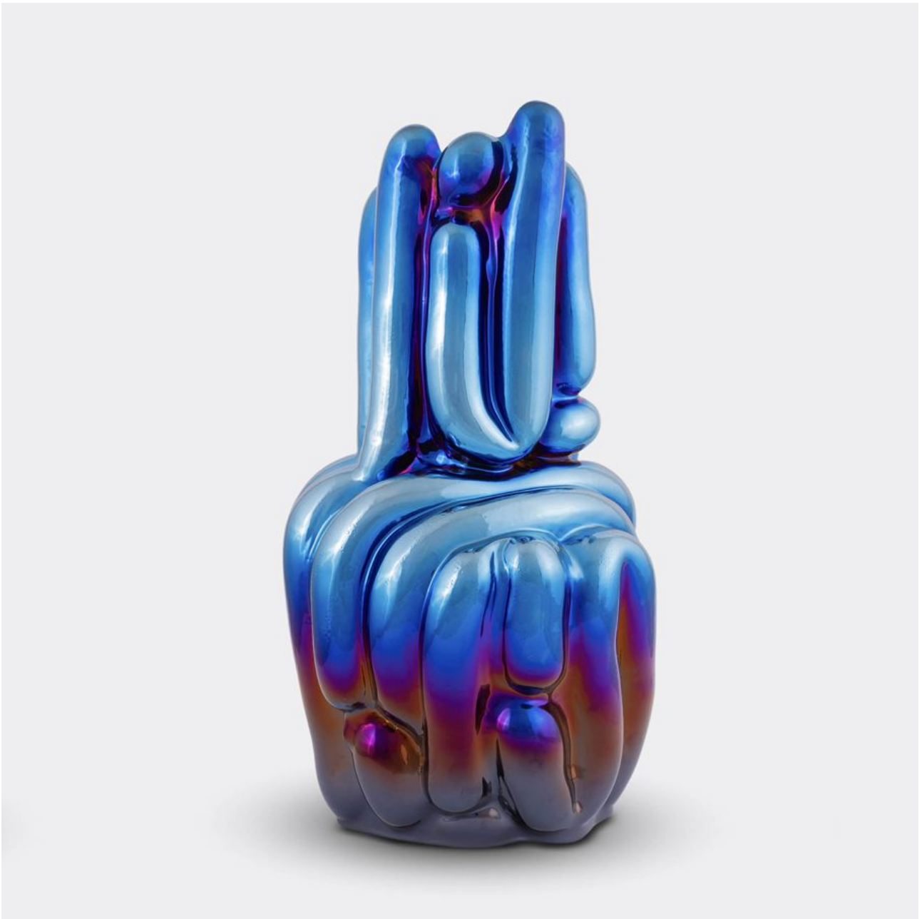
FETISHMOPRHY VASE BLUE VASE 55 cm 1 ks french porcelain / transparent glaze / titanium-plated / blue