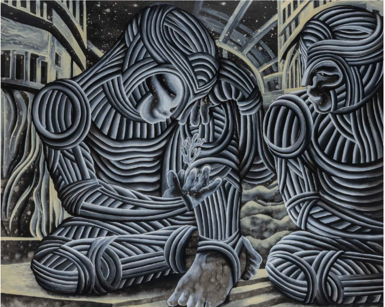
BS 1/ Treatment Institute akryl na plátne, 200 x 250 cm, 2024