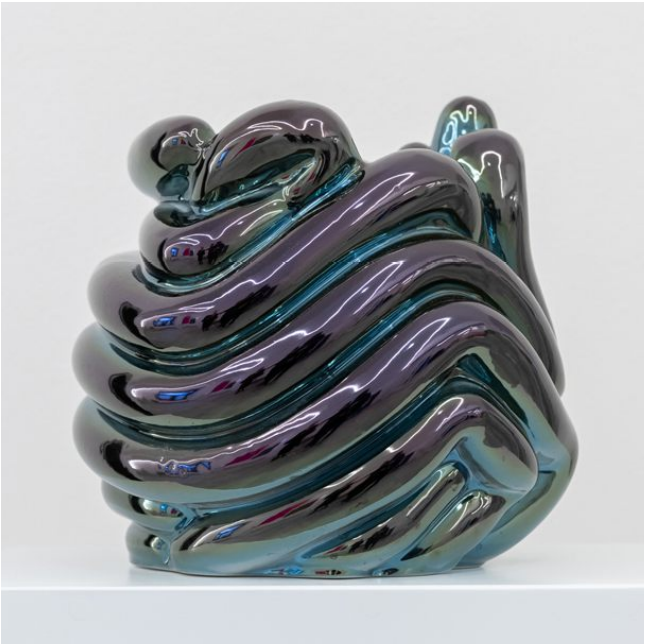
FETISHMOPRHY VASE BLUE VASE 55 cm 1 ks french porcelain / transparent glaze / titanium-plated/ dark blue