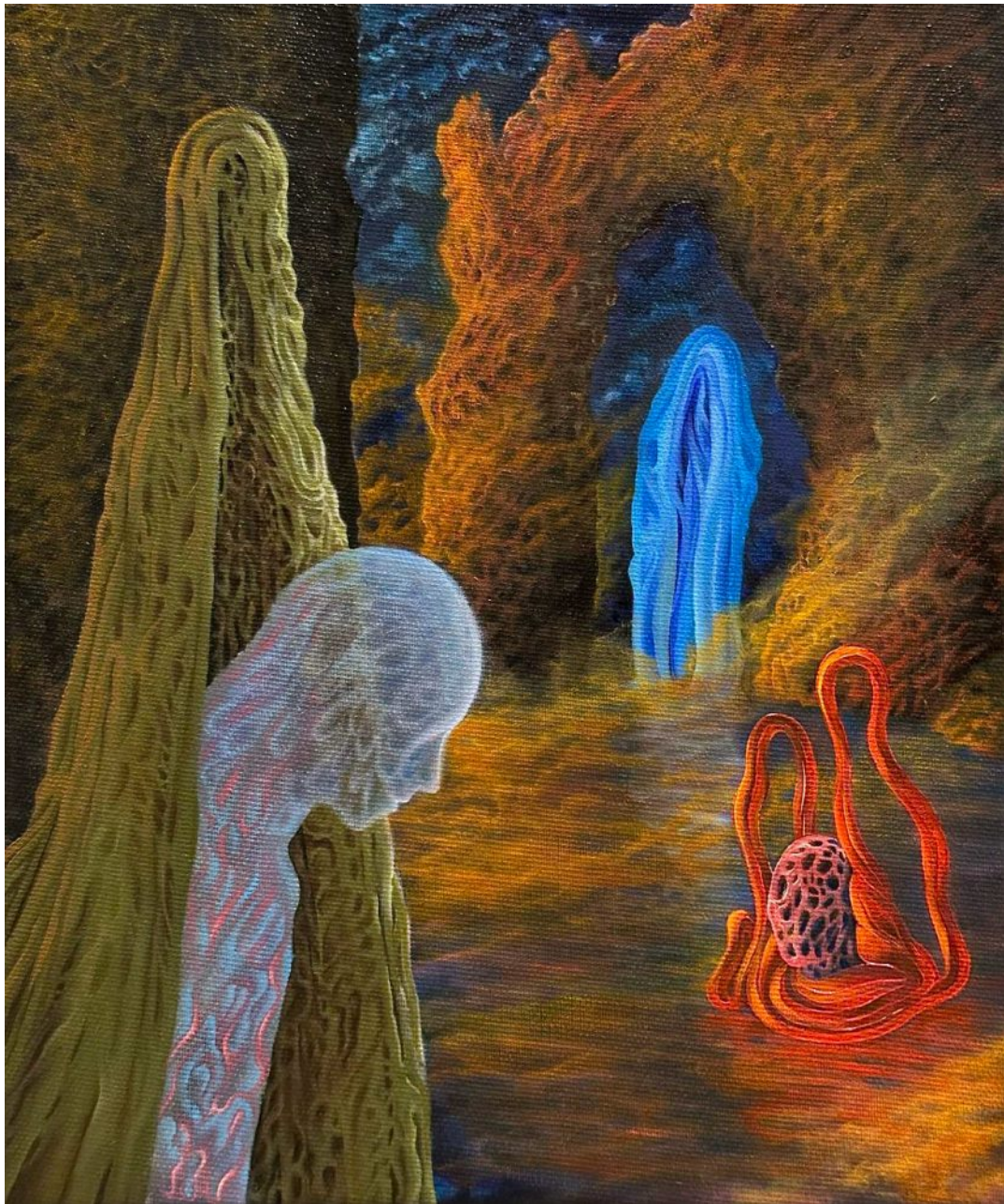
BS 8/ Hydrotherapy olej na plátne, 30 x 25 cm, 2026