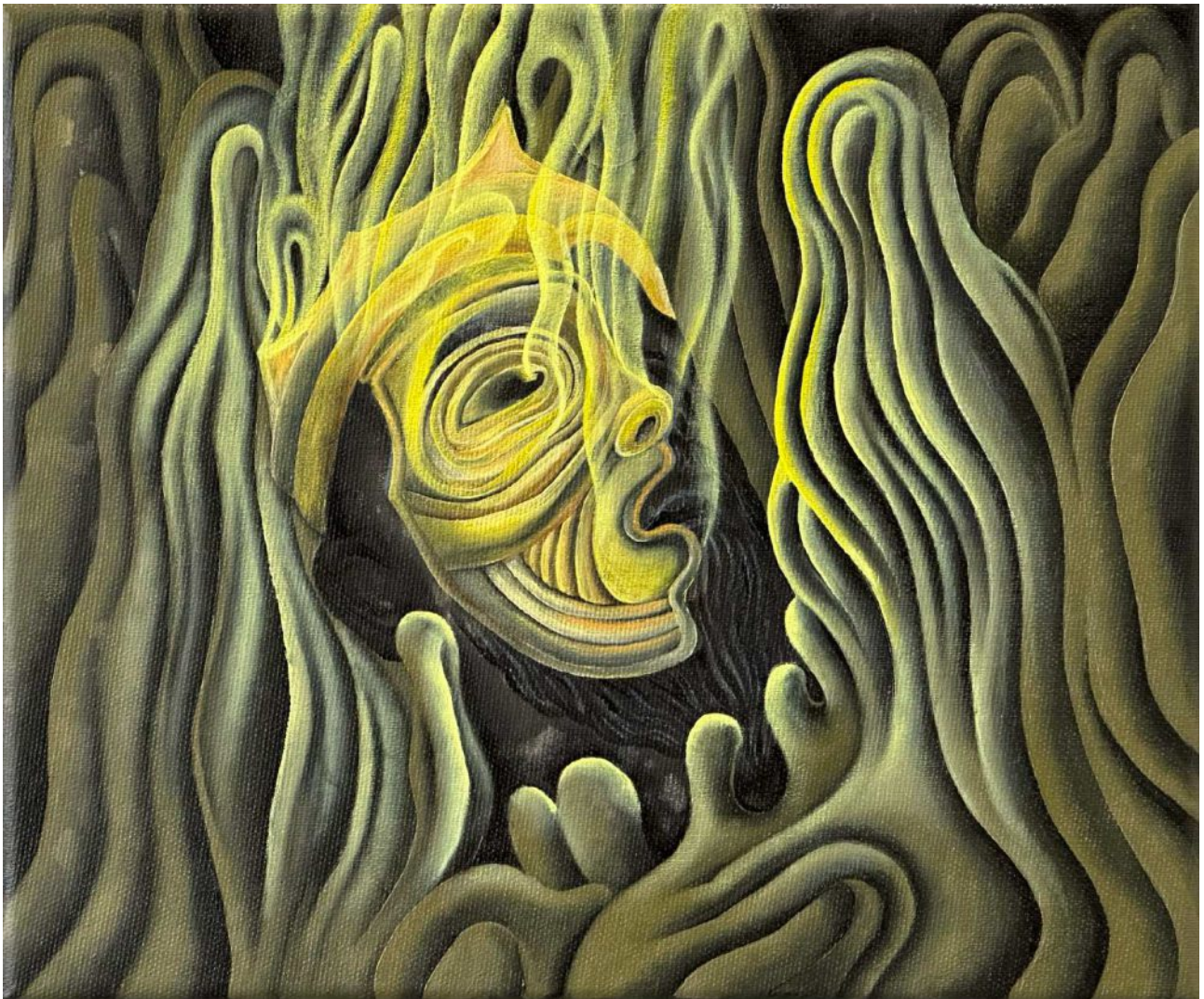
BS 10/ All the Gods have abandoned me olej na plátne, 25 x 30 cm, 2025