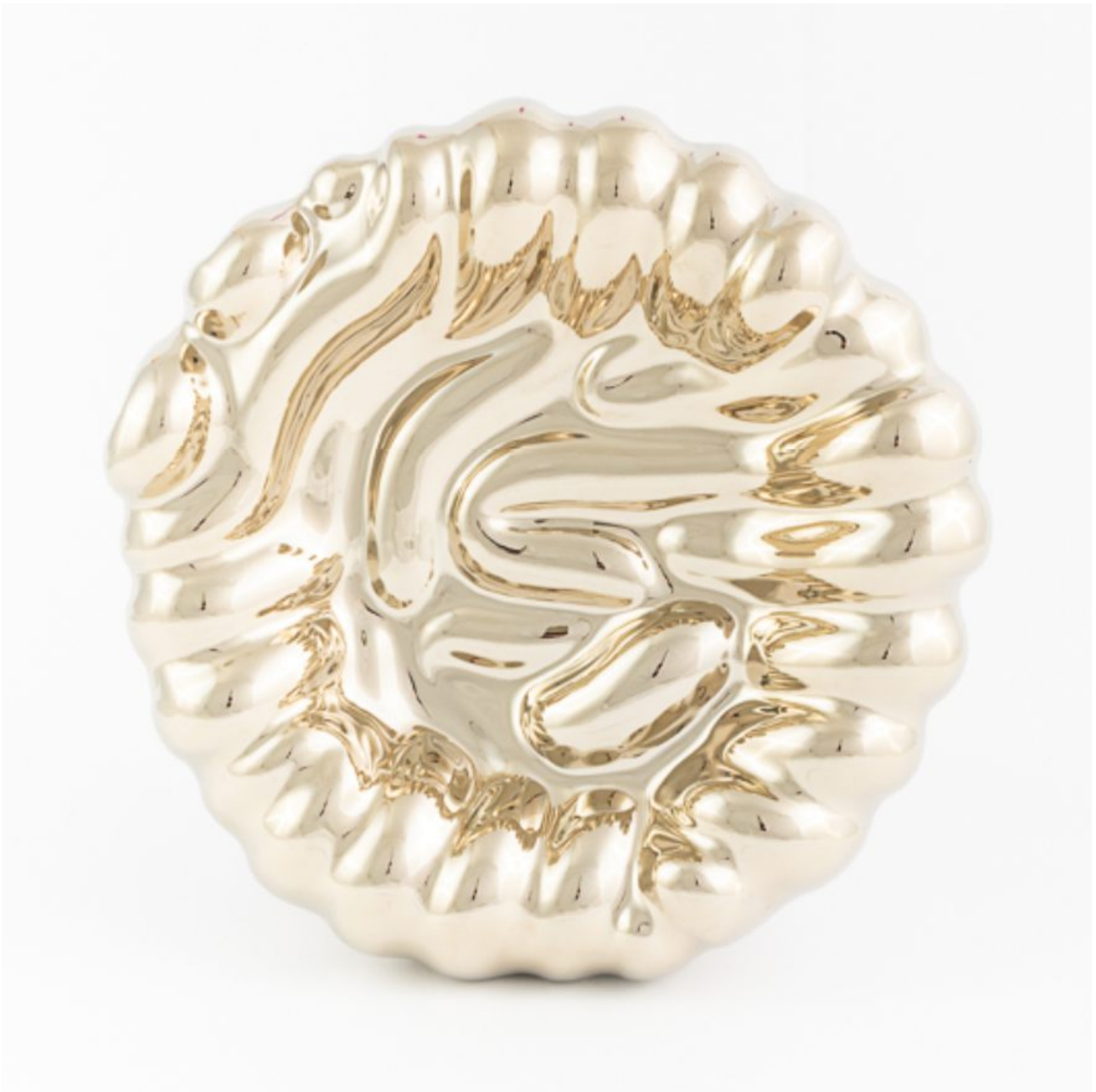
FETISHMOPRHY OBJECTS S 20 cm 1 ks french porcelain / transparent glaze / titanium-plated soft gold