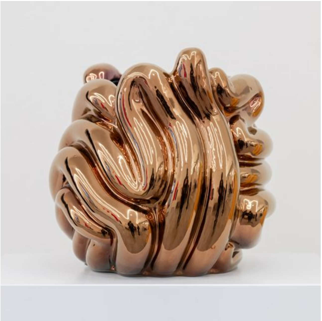
FETISHMOPRHY VASE BLUE VASE 55 cm 1 ks french porcelain / transparent glaze / titanium-plated/ copper