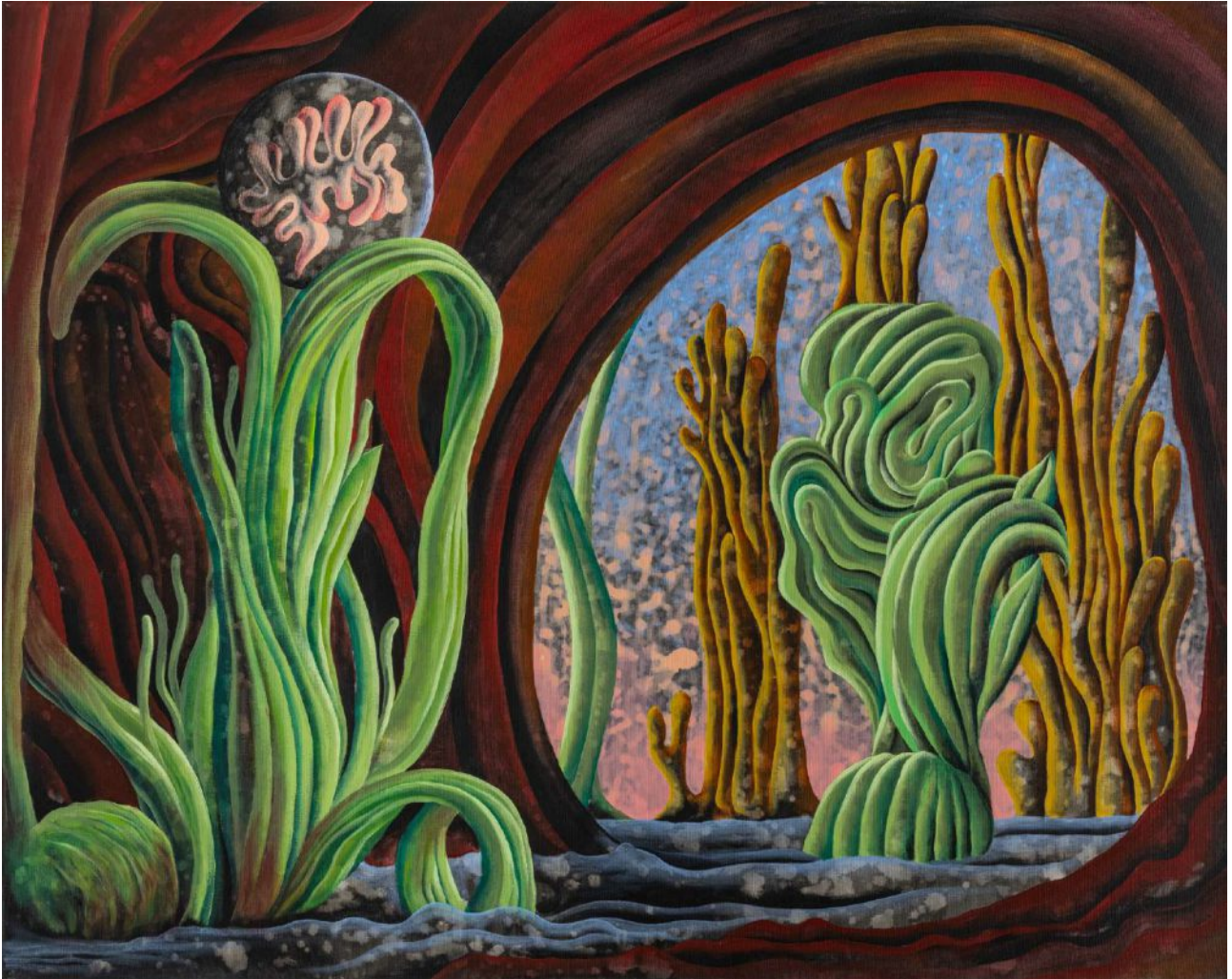
BS 6/ Level #1 akryl na plátne, 80 x 100 cm, 2024