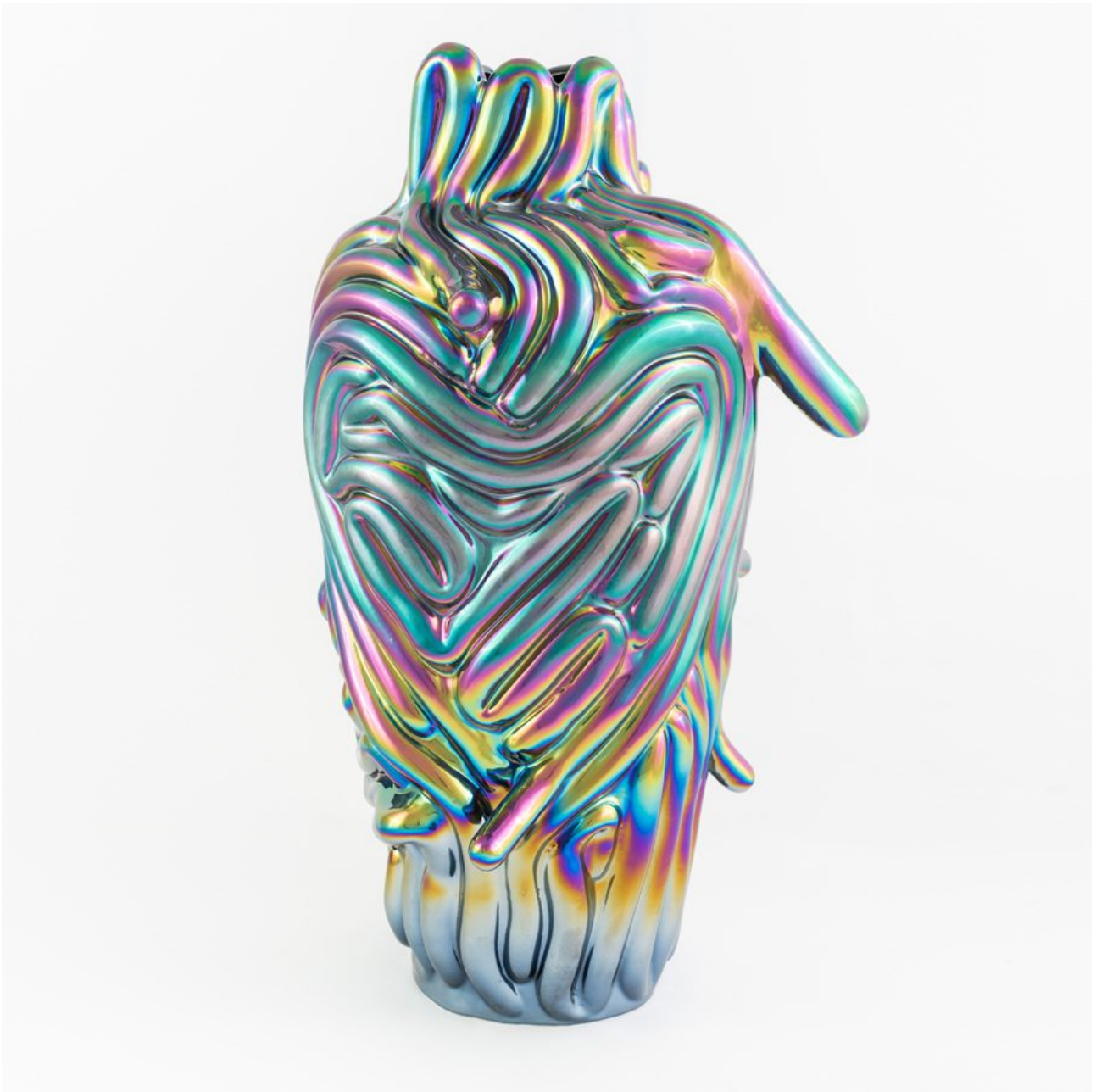
FETISHMOPRHY FLOWER 49 cm 1 ks french porcelain / transparent glaze / titanium-plated pearl