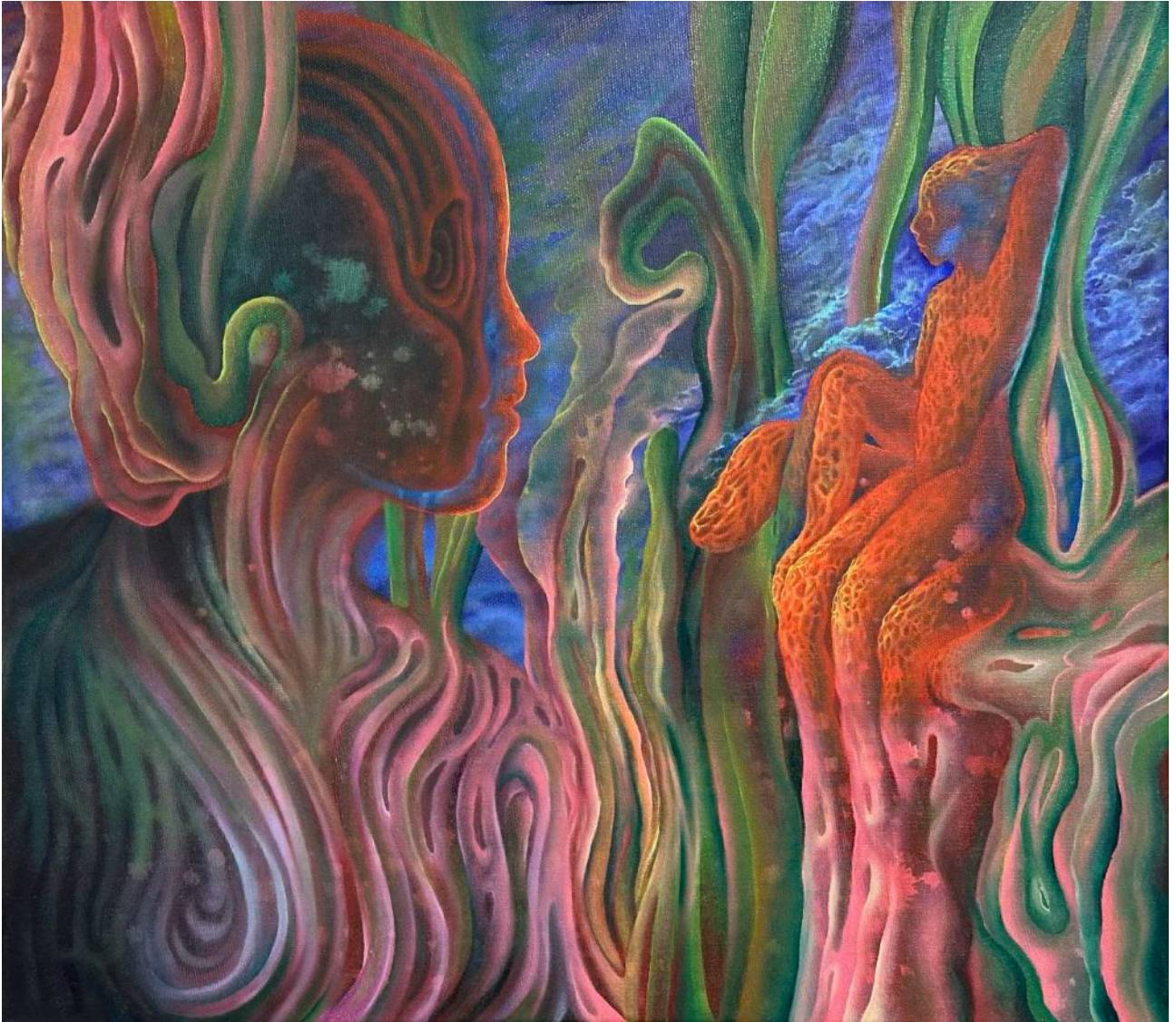
BS 4/ I'm way too high olej na plátne, 45 x 50 cm, 2025