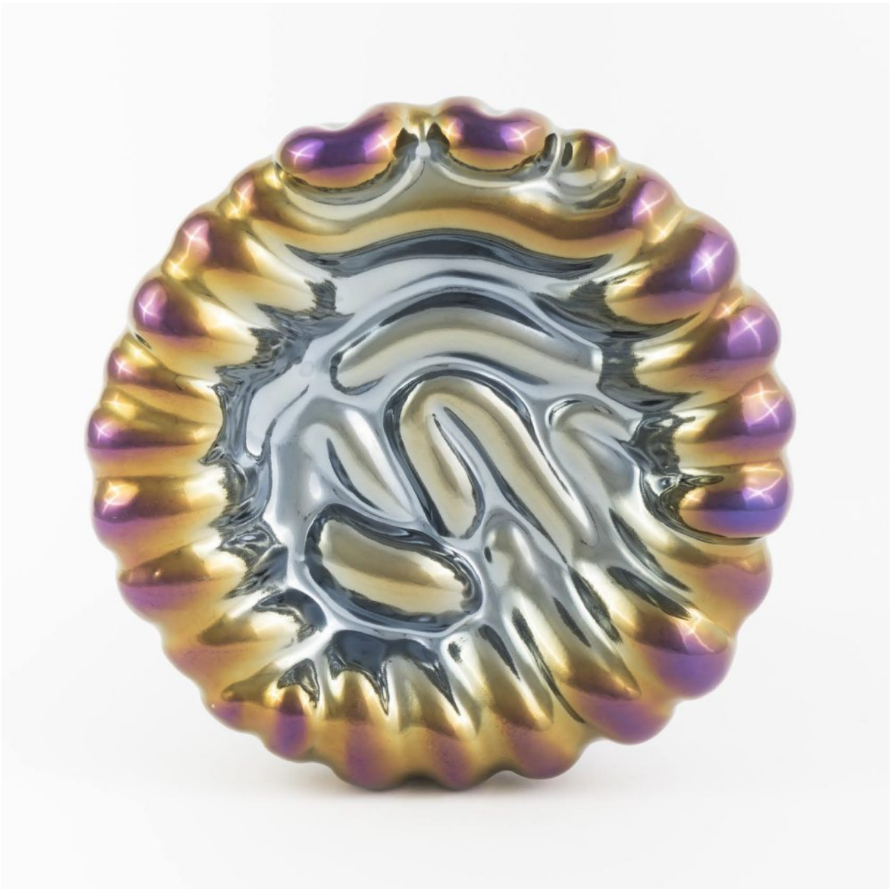
FETISHMOPRHY OBJECTS S 20 cm 1 ks french porcelain / transparent glaze / titanium-plated pearl