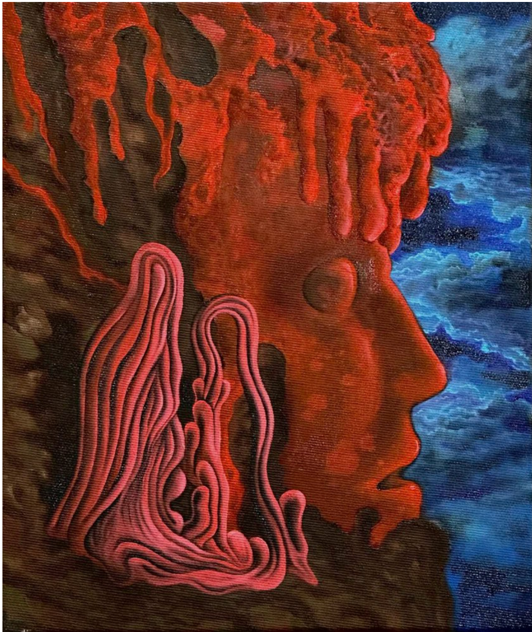
BS 7/ The Blood Mountain olej na plátne, 30 x 25 cm, 2026