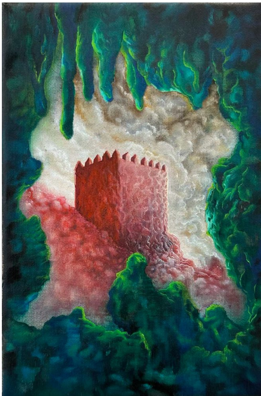
BS 12/ Muscular Castle olej na plátne, 30 x 20 cm, 2025