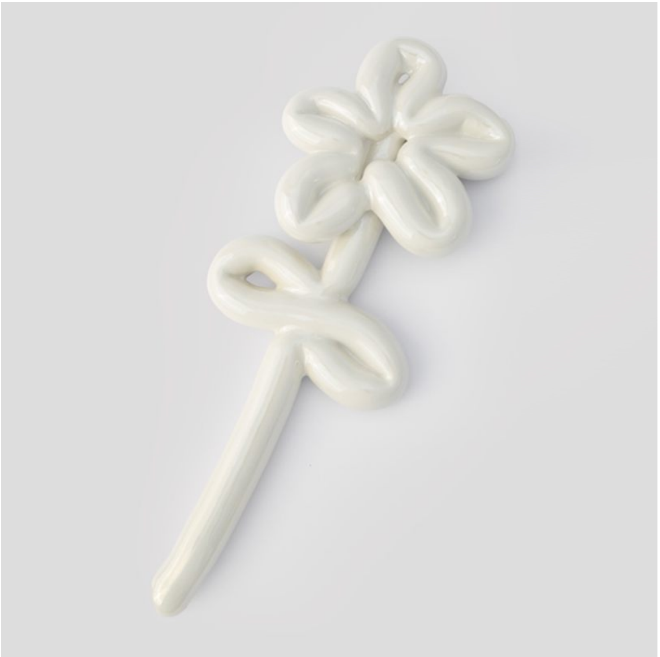
FETISHMOPRHY FLOWER 49 cm 1 ks french porcelain / transparent glaze / titanium-plated pearl