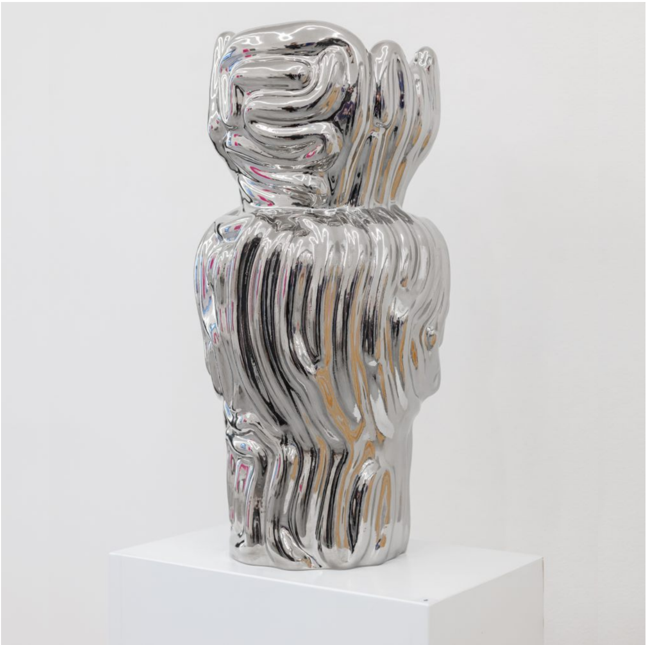
FETISHMOPRHY VASE PLATINUM 54 cm 1 ks french porcelain / transparent glaze / titanium-plated platinum