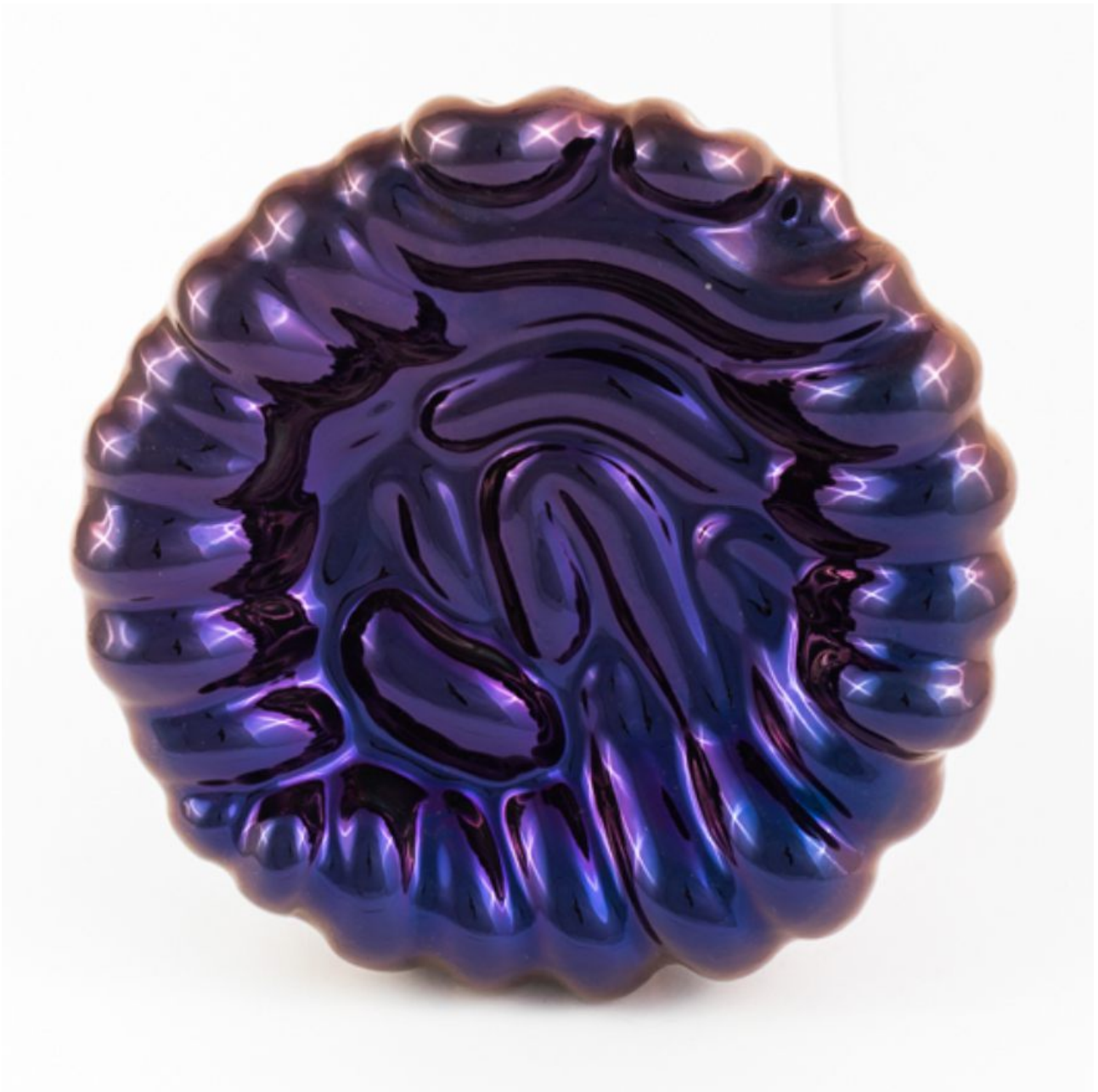
FETISHMOPRHY OBJECTS S 20 cm 3 ks french porcelain / transparent glaze / titanium-plated violet