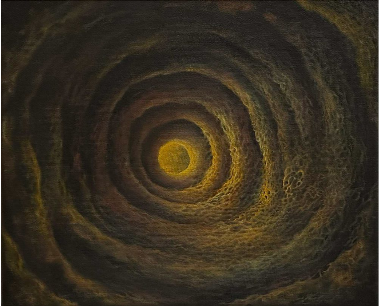
BS 11/ Down in the Hole olej na plátne, 25 x 30 cm, 2026