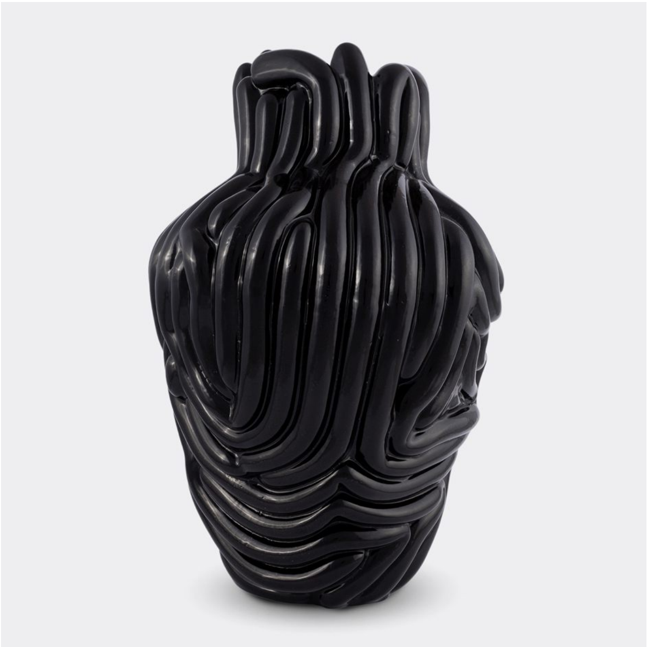
FETISHMOPRHY VASE BLACK BIG 60 cm 1 ks french porcelain / black glaze