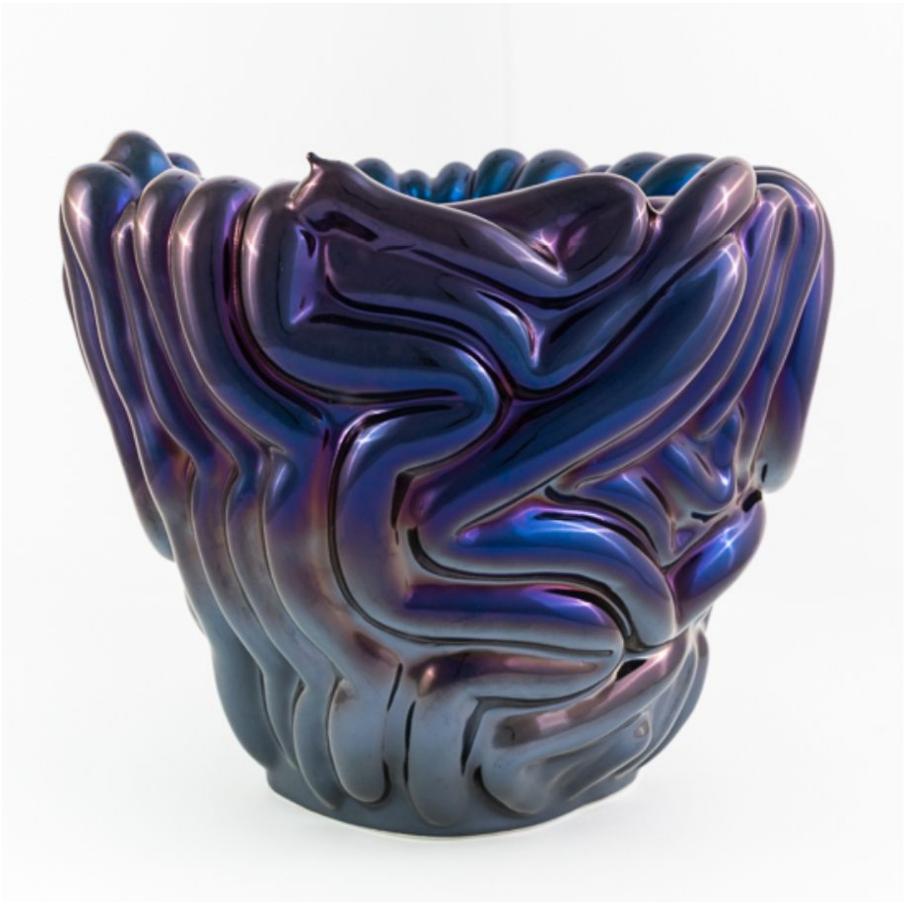
FETISHMOPRHY OBJECTS L 37 cm 1 ks french porcelain / transparent glaze / titanium-plated / violet